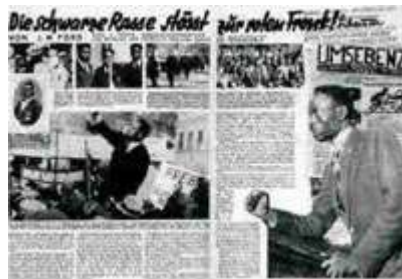
Image of one issue of the Arbeiter Illustrierte Zeitung (Worker's Illustrated Magazine). Title: Life and battle of the black race