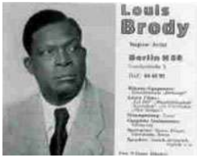
An ad (placed by Brody himself)