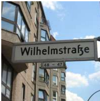
The Wilhelmstrasse where the anti-colonial activities were held at the house of the Münzenberg Company